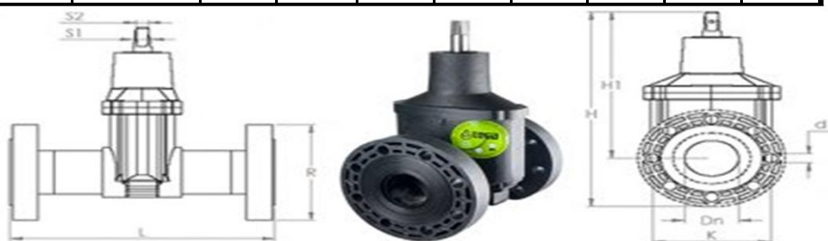
Задвижка ПЭ-100 с фланцами