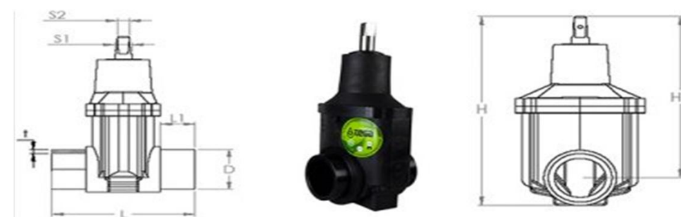
Задвижка ПЭ-100 с короткими патрубками