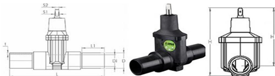
Задвижка ПЭ-100 с удлиненными патрубками

наш сайт: www.dnprremont.dp.ua 04.06.2013 г.