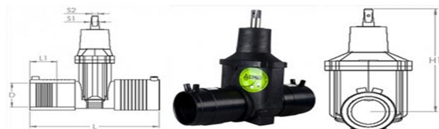
Задвижка ПЭ-100 с терморезисторными муфтами